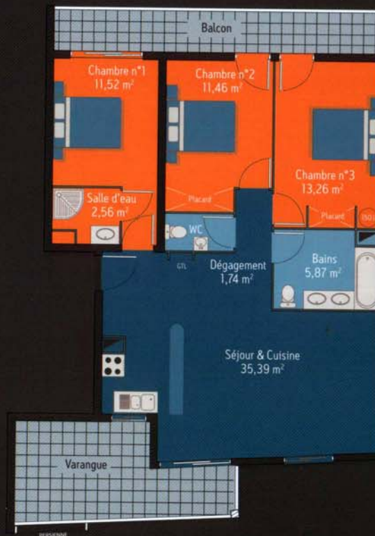
TABLEAU DES SURFACES T4